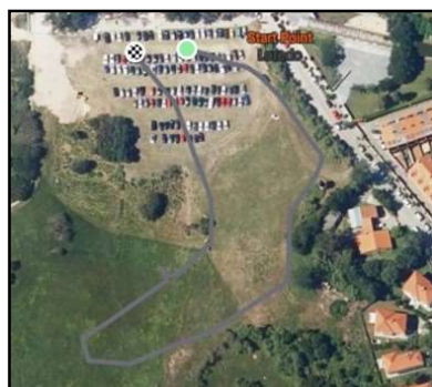
Circuito A: 500m

* Los premios absolutos y máster 40 y 50 no son acumulativos. Los atletas sub23 y sénior únicamente optan a los premios de categoría absoluta.